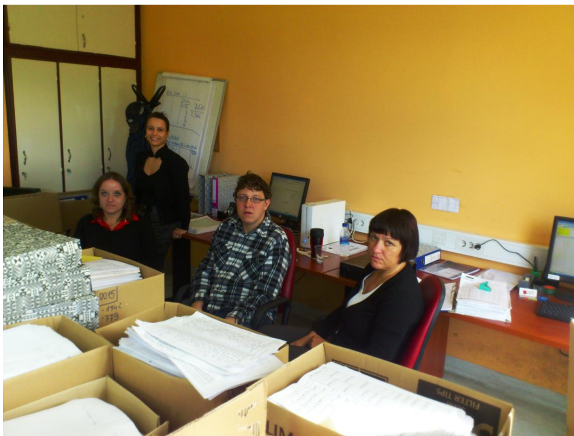
Projekt izvaja v okviru Operativnega programa razvoja človeških virov za obdobje 2007 - 2013, 4. Razvojne prioritete Enakost možnosti in spodbujanje socialne vključenosti , 4. 1. Prednostne usmeritve Enake možnosti na trgu dela in krepitev socialne vključenosti

Kot odraz uspeha aktivnosti projekta in projekta kot celote naj navedemo, da sta še dva udeleženca, po zaključku usposabljanja in prvotni vključitvi v javna dela, zaposlena v zaposlitvenem centru, kar pomeni, da smo v okviru projekta omogočili zaposlitev 7 osebam.